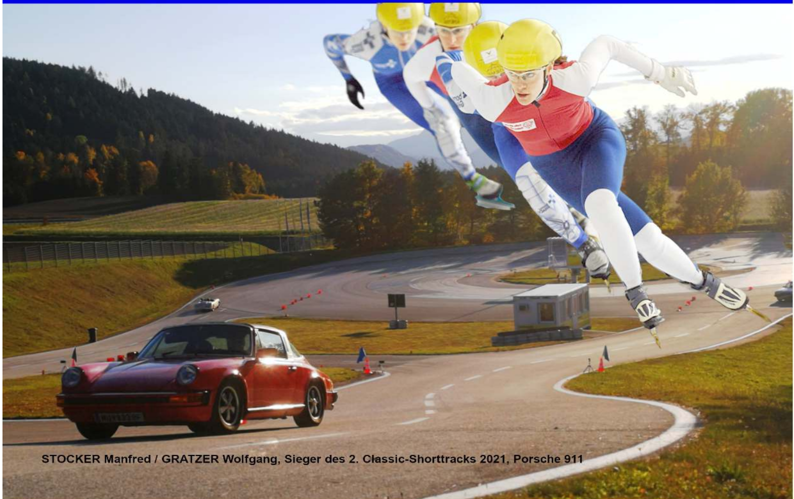
STOCKER Manfred / GRATZER Wolfgang, Sieger des 2. Classic-Shorttracks 2021, Porsche 911